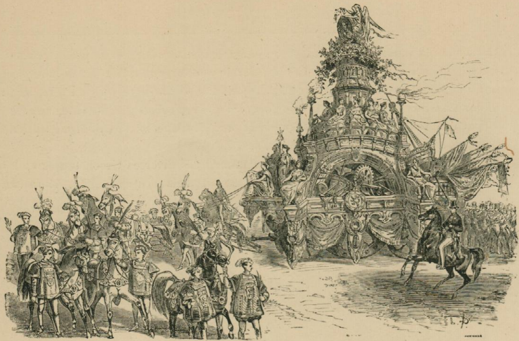
Char de la Paix.