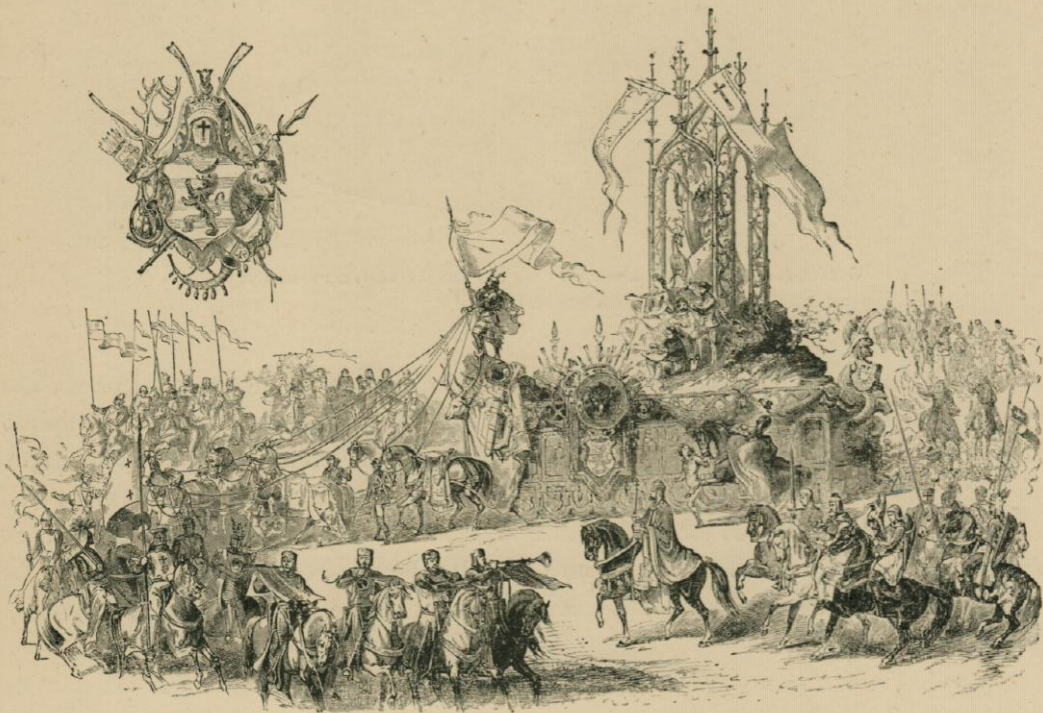
Char du Luxembourg.

CAVALCADE ORGANISÉE A L'OCCASION DU XXV e ANNIVERSAIRE DE LÉOPOLD I er .